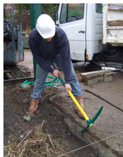
Pioche Batipro Novagrip

* Enquête Ipsos réalisée pour LEBORGNE auprès de 200 artisans maçons et entreprises de maçonnerie.