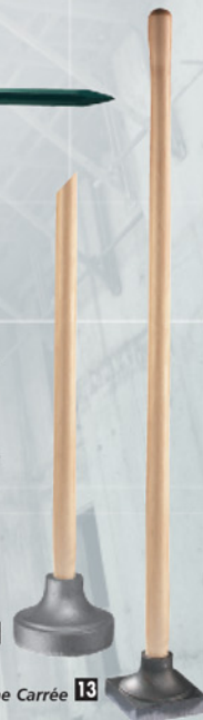
Dame Carrée 13